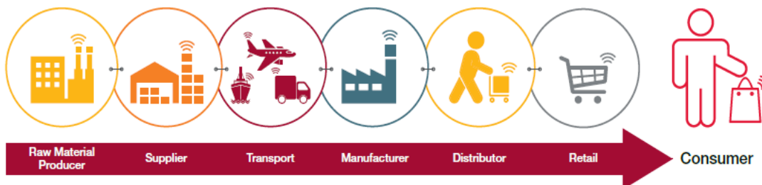
Gambar 3. Digitalisasi pada Semua Lini Bisnis (CGI 2017)

Pelaku usaha meyakini bahwa penggunaan media digital, terutama untuk perdagangan online , akan memberikan banyak manfaat (Baase 2013). Client Global Insights (CGI) yang merupakan perusahaan konsultan bisnis dan IT internasional menggambarkan manfaat digitalisasi pada semua lini bisnis mulai dari pengelolaan bahan baku, pemasok, transportasi, manufaktur, distribusi, hingga penjualan seperti pada Gambar 3 (CGI 2017). Digitalisasi perusahaan dengan integrasi teknologi akan mengoptimalkan rantai produksi (Gehrke et al. 2015). Selain itu juga mengubah cara produksi dan pemasaran produk (Bédard-Maltais 2017). Pemasaran dengan teknologi digital membutuhkan biaya yang lebih sedikit dibandingkan dengan cara konvensional (Hood, Brady, and Dhanasri 2016). Sebuah penelitian menunjukkan bahwa digitalisasi pada lini bisnis perusahaan kecil dan menengah dapat meningkatkan efisiensi rata-rata sebesar 3,3% per tahun (Geissbauer et al. 2014). Efisiensi didapatkan karena adanya pengurangan biaya operasional perusahaan (CGI 2017; Geissbauer et al. 2014; Bédard-Maltais 2017; Hood, Brady and Dhanasri 2016).