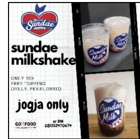
Gambar 2. Contoh Promosi dengan Foto